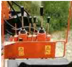
Joy-Stick rendszerű vezérlőtömbök

A különböző munkaeszközök széles körű felhasználást tesznek lehetővé.